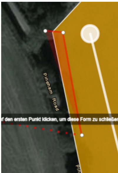
Setzen von Markierungspunkten